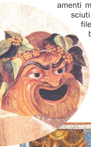
• Mosaico con maschera teatrale indossata dagli attori (Roma, Musei Capitolini).

Le tragedie di Ennio 1 andarono perdute, mentre ci sono rimaste le commedie di Terenzio 2 e di Plauto 3 , con intrecci complicati, ribaltamenti di situazioni. Queste vicende erano interpretate perlopiù da attori maschi, perché era assolutamente disdicevole per una donna calcare le scene; essi potevano anche arricchirsi, perdevano però i diritti giuridici. I protagonisti recitavano con maschere, personae , dai lineamenti molto marcati per essere riconosciuti anche dal pubblico delle ultime file; le maschere femminili erano bianche, mentre quelle maschili brune e facevano da cassa di risonanza, intensificando il tono di voce.