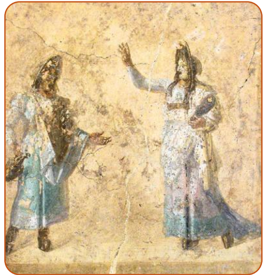
• Scena di tragedia (Napoli, Museo Archeologico).

L'interpretazione di un personaggio poteva essere affidata a due attori: uno era l' hystrion che si muoveva con agilità e grazia, mimando la vicenda, mentre il cantor era la voce. La musica aveva un ruolo molto importante, perché sottolineava i momenti di maggior tensione o di comicità.