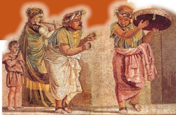
• Flauto, maschere e tamburello. I musici in una rappresentazione scenica (Napoli, Museo Archeologico Nazionale).