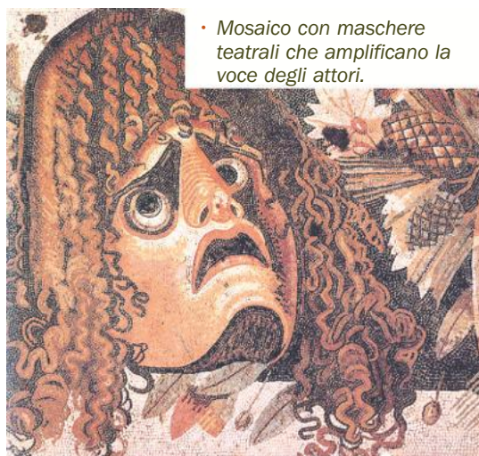
• Mosaico con maschere teatrali che amplificano la voce degli attori.

Il teatro romano era modellato su quello greco, ma con differenze che attraverso i secoli si fecero sempre più rilevanti. A Roma gli spettacoli, sia la tragedia che la commedia, andarono perdendo quel carattere religioso legato al culto di Dioniso che contraddistingueva invece il teatro greco. Spettacolo profano, dunque, che si inseriva nel quadro dei ludi e che necessitava di strutture adeguate per accogliere spettatori e attori. Di tradizione italica erano le atellanae , rappresentazioni agresti, interpretate da attori popolari che avevano ruoli fissi, come il furbo, il vecchio rimbambito, lo sciocco... Anche i fescennini , sempre