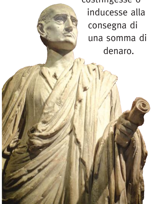
■ Statua di Cicerone, grande politico e oratore, vissuto tra il 106 e il 43 a.C.

costringesse o inducesse alla consegna di una somma di denaro.