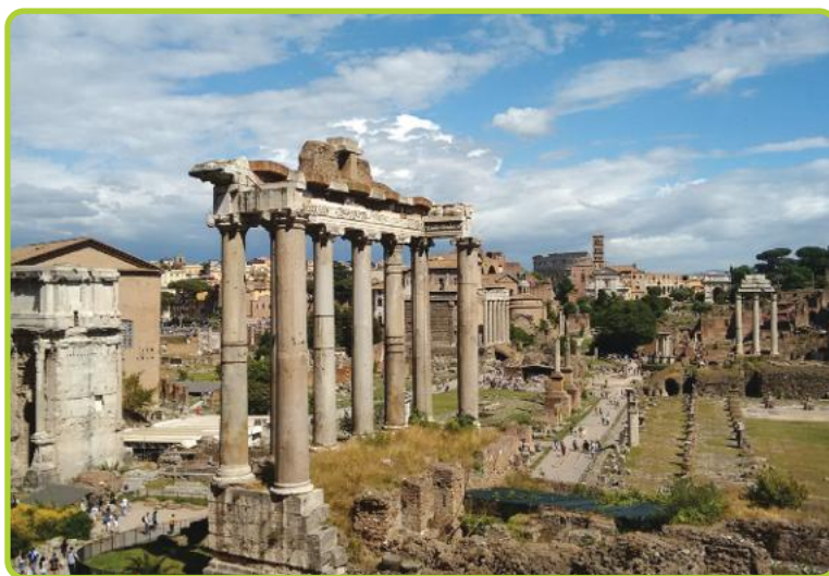
■ Veduta del Foro Romano, che era il centro politico, economico, giuridico e religioso di Roma.

Il processo iniziava con l'accusa in cui venivano elencate le presunte colpe dell'accusato. Seguiva l'azione della difesa dell'avvocato ( advocatus ) che aveva fino a tre ore per difendere l'accusato. Gli avvocati mostravano grande perizia oratoria, ricorrendo a tutte le risorse della retorica. Si trattava di un'arte coltivata per anni e i giovani rampolli delle famiglie patrizie spesso seguivano le lezioni dei più noti avvocati. Dopo le orazioni ( orationes ) dell'accusa e della difesa, iniziava un dibattito ( altercatio ) con brevi domande e risposte per chiarire i singoli fatti.