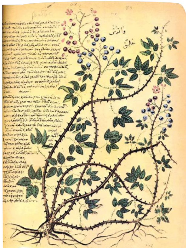
• Mora selvatica descritta nel De Materia Medica di Dioscoride (Vienna, Biblioteca Nazionale).

Abbiamo numerosi reperti che testimoniano l'uso di "ferri del mestiere", non solo odontoiatrici, ma anche chirurgici; venivano infatti praticati interventi agli occhi, sulle varici, ai reni, per eliminare i calcoli. Le donne preferivano farsi curare dalle "medichesse", che potevano anche vivere all'interno delle case dei ricchi. Vi erano quindi varie specializzazioni: grande era soprattutto il numero di oculisti ( medici ocularii ) nelle terre sottomesse a Roma. Curavano con il collirio, quasi sempre a base di mirra, croco, solfato di ferro. Poteva essere liquido, ma più frequentemente solido, compresso in bastoncini. Su di essi erano impressi, in apposite etichette, il nome del medico, del preparato e lo specifico uso. Non mancavano aggettivi che esaltavano il prodotto, come "insuperabile", "regio", e persino "divino". C'erano poi medici al seguito degli eserciti, oppure nelle caserme dei gladiatori, ancora chirurghi estetici, che riuscivano persino a cancellare dalla fronte il marchio infamante di uno schiavo ladro, divenuto libero e poi ricco.