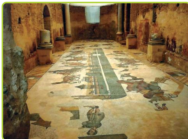
■ Una sala della Villa del Casale a Piazza Armerina in Sicilia.

Ai tempi della fondazione Roma fu abitata da agricoltori e allevatori, fatto testimoniato da reperti archeologici, da templi in onore del dio Pale e di Cerere, divinità delle messi, dal mito di Proserpina. Anche il termine pecunia , denaro, deriva da pecus , -oris = pecora, merce privilegiata di scambio in una società pastorale, quando non esisteva ancora il sistema monetario. Piccoli e grandi proprietari facevano rendere i loro poderi, creando un'economia basata anche sul commercio. Durante i periodi di guerra, i contadini diventavano soldati e costituivano il nerbo delle potenti legioni. Con l'espansione del dominio romano, si crearono vaste proprietà assegnate a coloro che si erano distinti nelle guerre di conquista e fatte coltivare agli schiavi. Molte famiglie patrizie vivevano nella ricchezza, grazie alle rendite derivanti dall'agricoltura, praticata nelle ville di campagna ( villae rusticae ).