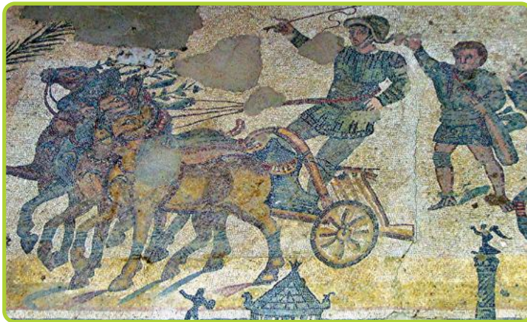
■ Mosaico rappresentante una corsa con i cavalli, Villa del Casale.

in città e trascorreva pochi giorni in campagna per controllare se il fattore ( vilicus ) avesse rispettato i suoi ordini e se la resa dei campi non fosse inferiore alle attese.