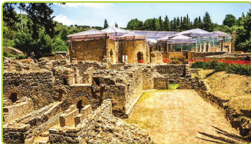
■ La Villa Romana del Casale è una magnifica dimora rurale, costruita in un periodo compreso tra il 310 e il 340 d.C.

La vita all'interno della villa non era certo facile per i servi che erano controllati costantemente nel loro duro lavoro: non c'era mai riposo, nemmeno durante le festività. In autunno dovevano seminare, raccogliere i rutti del bosco, vinificare. In primavera curavano le viti, gli alberi da frutto, falciavano l'erba, poi in estate mietevano; ogni giorno accudivano gli animali, producevano il formaggio ... Quando il tempo era piovoso e freddo, i servi si dedicavano a riordinare la cantina, riparare le botti, a sistemare gli attrezzi rotti. Era una vita dannata, infatti, se si ammalavano, si vedevano ridurre la razione alimentare, perché improduttivi. Il padrone spesso viveva