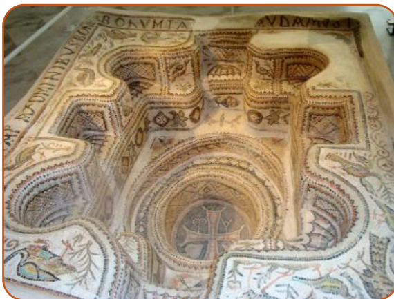
• Mosaico nelle terme di Thuburbo Majus, in Tunisia.

Gli edifici termali romani erano presenti fin dalla seconda metà del III secolo a. C., ma soprattutto con l'età imperiale diventarono sontuosi, ricchi di marmi e molto estesi. I Romani sapevano sfruttare l'acqua per le proprie necessità: dagli acquedotti alle fontane, alle terme, gli ingegneri idraulici utilizzavano in modo sapiente questo bene prezioso. L'acqua veniva riscaldata bruciando enormi quantità di legna ed il calore passava attraverso intercapedini del pavimento.