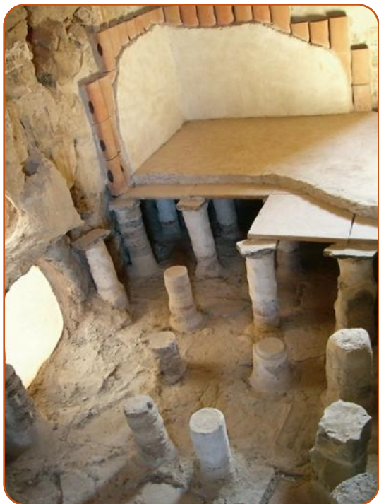
• Le terme di Masada (Israele).

Il cuore delle terme era il calidarium , molto riscaldato, attrezzato con bacini, tinozze e anche munito di una vasca per nuotare. All'interno del calidarium , si trovava il laconicum o vaporarium , con vapore bollente, dove si faceva uso del sapone che arrivava da Marsiglia. Dopo aver sudato, il bagnante si cospargeva d'olio e si raschiava con lo strigile, uno strumento