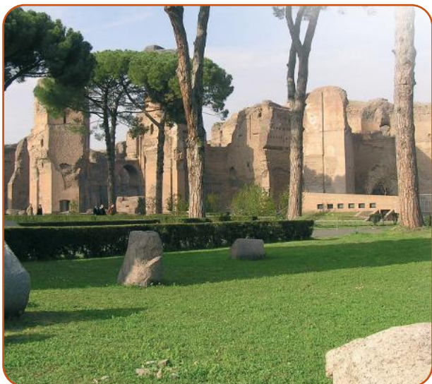
• Terme di Caracalla a Roma.

Vi erano ancora locali destinati alla ginnastica, sphaeristeria , dextritorium , e all'aperto, grandi piscine, piscinae natatoriae . Le terme non svolgevano solo la funzione di bagni pubblici, ma includevano ristoranti, tabernae , biblioteche, sale per conferenze: tutto ciò ci permette di affermare che i Romani si dedicavano alla vita gaudente, alla cura del corpo, ma non trascuravano le gioie dello spirito perché si leggevano versi, si declamavano le opere dei grandi autori e se ne decretava il successo.