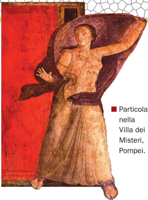
■ Particolare nella Villa dei Misteri, Pompei.