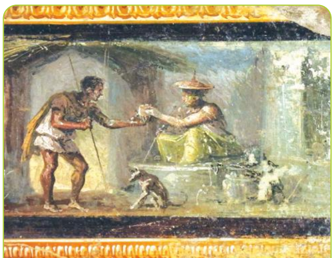
■ Fattucchiera con cappello di paglia. Casa dei Dioscuri, Pompei.

lamina di piombo era scritto a chiare lettere il nome della persona odiata, con formule di maledizioni misteriose, ad esempio BESCU, BEREBESCU, ARURARA, e con incisione di immagini funebri (un demone, una falce, un mostro, una barca che attraversa le acque dell'oltretomba). Sono state trovate lamine con consacrazione agli dei infernali di parti del corpo e invocazioni alla malattia e alla morte del maledetto. La lamina veniva gettata in una tomba, o in un pozzo, o in una sorgente di acqua calda. Contro una donna si legge: «Cacciatele fiere febbri in tutte le membra! Distruggetele, o dei infernali, l'anima e il cuore! Strangolatele la gola!» Tali pratiche erano diffuse perlopiù fra gente ignorante, come si deduce dai documenti, scritti con un linguaggio spesso sgrammaticato. Molte di queste superstizioni sono passate attraverso il tempo: si pensi alla stregoneria, fino al secolo XVIII esercitata con rituali simili a quelli del mondo romano.