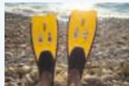
7 ___ palmes