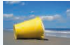
8 ___ seau