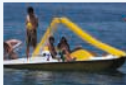
6 ___ pédalo