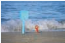
5 ___ pelle