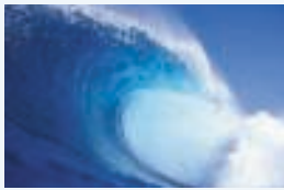
1 ___ vague