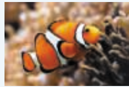
3 ___ poisson