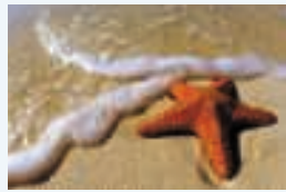
2 ___ étoile de mer