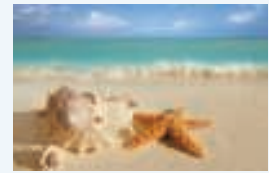
4 ___ coquillages